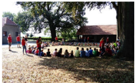
Text und Foto: Thomas Becker

Zur Verstärkung unseres Teams suchen wir noch motivierte Betreuer*innen. Du solltest mindestens 16 Jahre alt sein und Spaß im Umgang mit Kindern haben und gerne im Team zusammenarbeiten. Interesse geweckt? Dann melde dich einfach unter ferienspass-neulouisendorf@web.de bei uns.